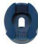
Форсунка Rain Curtain, вид спереди