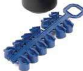
Роторы Серии 5000