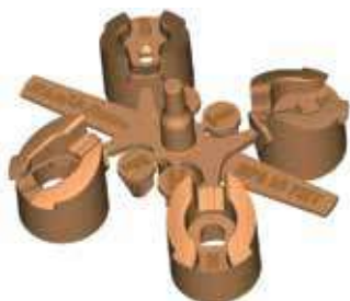
Мини-комплект на четыре форсунки