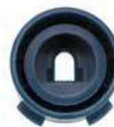
Форсунка Rain Curtain, вид сзади