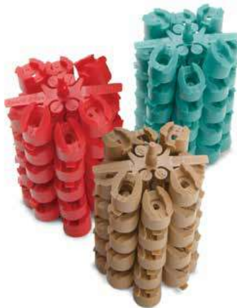
Форсунки MPR для роторов 5000 серии

5000MPR: упаковка, содержащая 30 комплектов форсунок 5000-MPR: 10 шт. 5000-MPR-25, 10 шт. 5000-MPR-30 и 10 шт. 5000-MPR-35